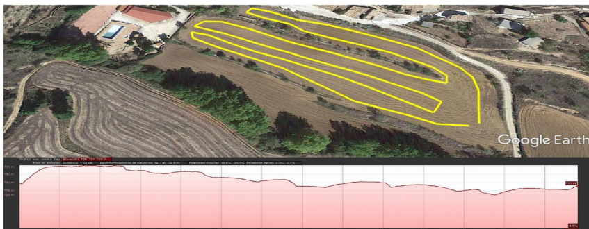
CIRCUITO C 1.040 MTS.