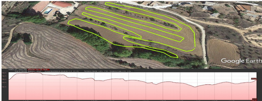
CIRCUITO B 1.450 MTS.